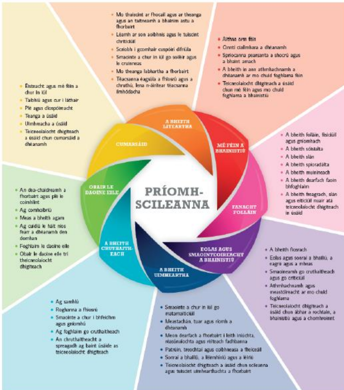
Fíor 1: Príomhscileanna na sraithe sóisearaí

I dteannta a n-inneachair agus a n-eolais shonraigh, tugann ábhair agus gearrchúrsaí na sraithe sóisearaí deiseanna don scoláire chun réimse leathan príomhscileanna a fhorbairt. Dírionn curaclam na sraithe sóisearaí ar ocht bpríomhscil.